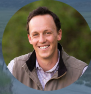
Senator Dylan Roberts